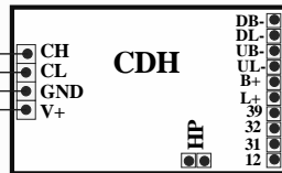
CDH Buton bağlantıları CFU kartı ile tamamen aynıdır.

Tek düğme tek yön toplama sistemlerde, trafik sistemine göre gideceği yön butonlarını bağlamanız yeterlidir.